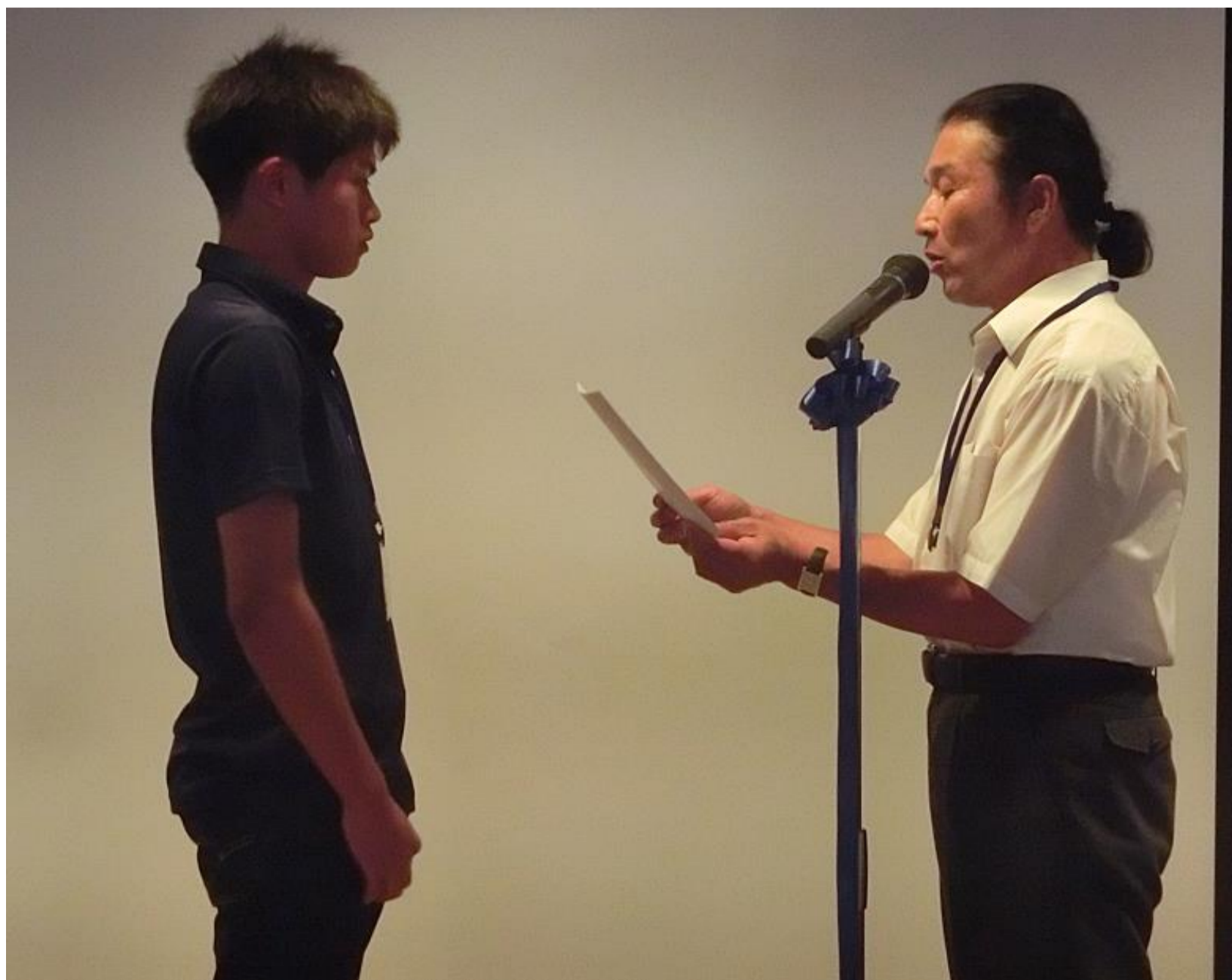
松田代表（機械工学科2年）