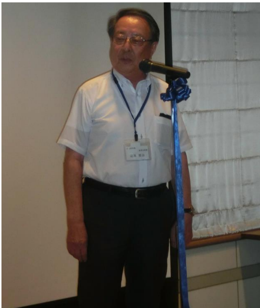
迫原新居浜高専校長