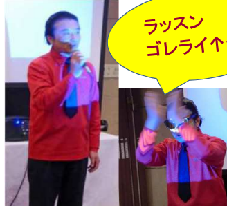
雄風会 高岡会長 (49年E卒)