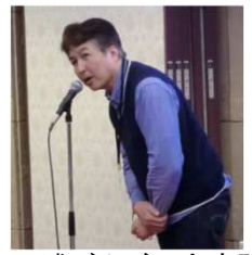
三浦びんごの会庶務 (57年M卒)