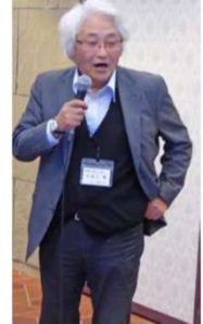
燧会 七五三HP担当理事 (49年M卒)