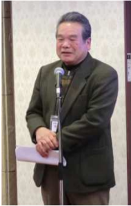
あきの会 得居会長 (42年M卒)