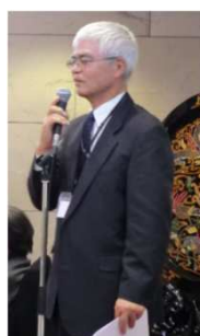
戸田びんごの会会長 (43年E卒)