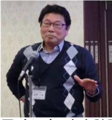
西原びんごの会会計監査 (50年M卒)