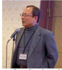
真田びんごの会HP担当 (51年M卒)